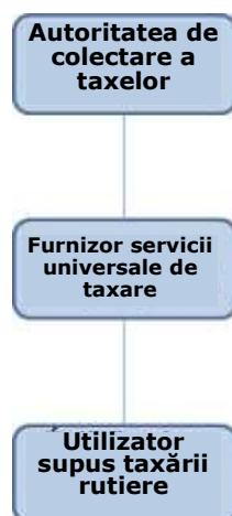
Figura 1 Raportul contractual dintre autoritatea de colectare a taxei rutiere, furnizorul de servicii universale de taxare rutieră și utilizatorul obligat la plata taxei rutiere

Raportul contractual dintre autoritatea de colectare a taxei rutiere, furnizorul de servicii universale de taxare rutieră și utilizatorul obligat la plata taxei rutiere este ilustrat de următorul grafic: