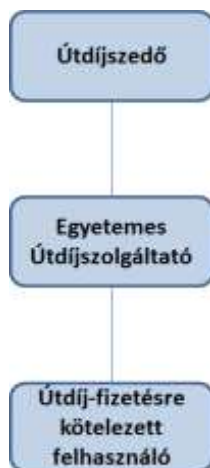
1. ábra - Útdíjszedő, az Egyetemes Útdíjszolgáltató és az Útdíj-fizetésre kötelezett felhasználó közötti szerződéses viszony

Az Útdíjszedő, az Egyetemes Útdíjszolgáltató és az Útdíj-fizetésre kötelezett felhasználó közötti szerződéses viszonyt az alábbi ábra szemlélteti: